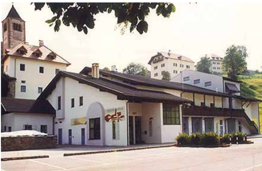
Im Vereinshaus Lengmoos wird die defekte Lichtenanlage ausgetauscht

Die Zufahrtsstraße zum Hof „Rappmannsbühl“ in Klobenstein befindet sich in einem schlechten Zustand und muss asphaltiert werden. Diese Straße ist im Verzeichnis des ländlichen Wegenetzes eingetragen und deshalb ist die Gemeinde für die außerordentliche Instandhaltung zuständig. Den Auftrag hat die Firma Bitumisarco GmbH erhalten (23.323,90 Euro).